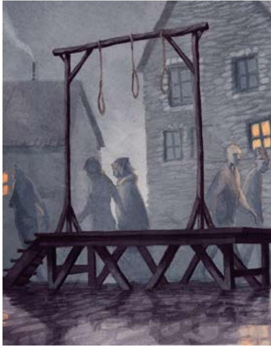
48 Figura 19. Es clausuraven les portes de la ciutat i s'establien penes, com la forca, per als contraventors