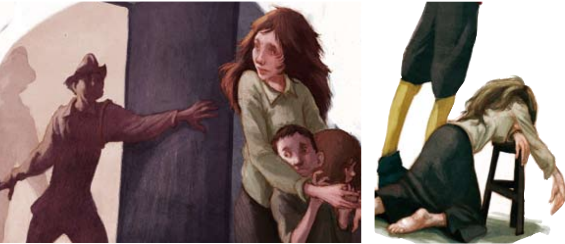
Figura 10 i 11. Els abusos dels soldats eren naturals