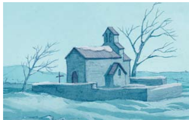
Figura 3. Església de Gallecs