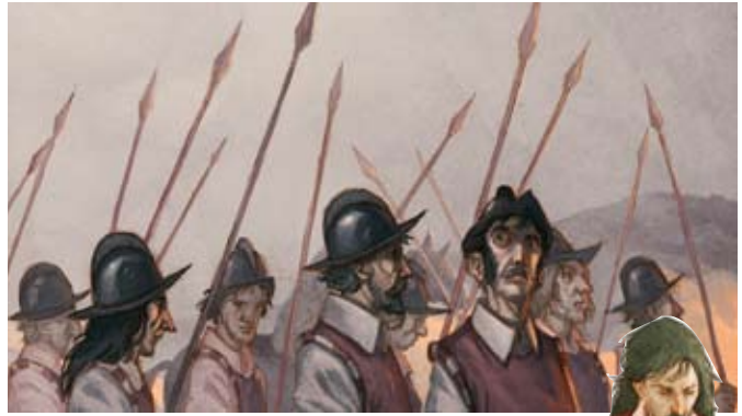
Figures 8 i 9. Una població famèlica havia de contribuir amb fills i menjar a sostenir les guerres

llantor quan hi havia moltes taques en la seva superfície i les temperatures resultants eren les adequades per a les collites de blat, i ho relacionava amb una baixada de preus dels mercats de cereals. L'any 1801 va anunciar que el preu del blat i l'ordi tenia una correlació real amb el cicle de taques solars.