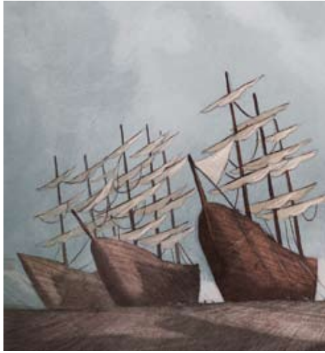
Figura 13. Els primers casos de pesta negra arribaren a València l'any 1647 en una vaixell procedent d'Algèria

greus conflictes bèl·lics entre pobles i civilitzacions.