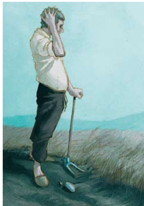
Figura 6. Collita perduda pel fred

Els estudis sobre els canvis de polaritat dels grups de taques i el fet que el 30% de l'exterior de l'interior del sol giri diferenciadament, de manera més similar a la superfície, són apassionants, tot i que no són el motiu principal d'aquest treball. Se sap que durant la Petita Edat de Gel (o mínim de Maunder) la temperatura mitjana global va disminuir fins a 0,5 kelvin 7 , molt per sota de la mitjana d'altres èpoques conegudes amb una població humana important sobre la superfície terrestre. Això va comportar un important avenç glacial i van fer inviables molts anys de