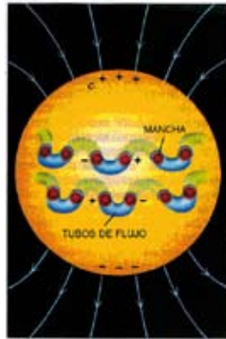
Figura 5. Gràfic extret de l'article Sol cambiante del físic solar Peter V. Foukal.