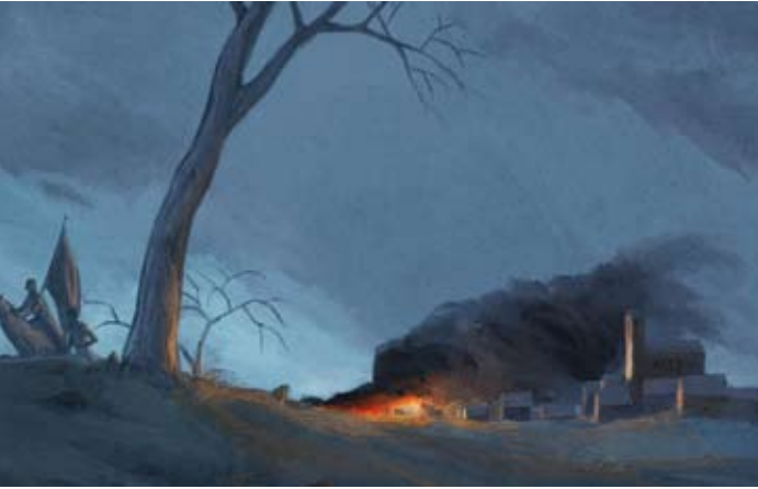
Figura 2. Les tropes causaven estralls al seu pas per pobles com Mollet

diumenge després de la Mare de Déu d'agost, és a dir, el diumenge posterior al 15 d'agost, és el que intento esbrinar des de fa molts anys.