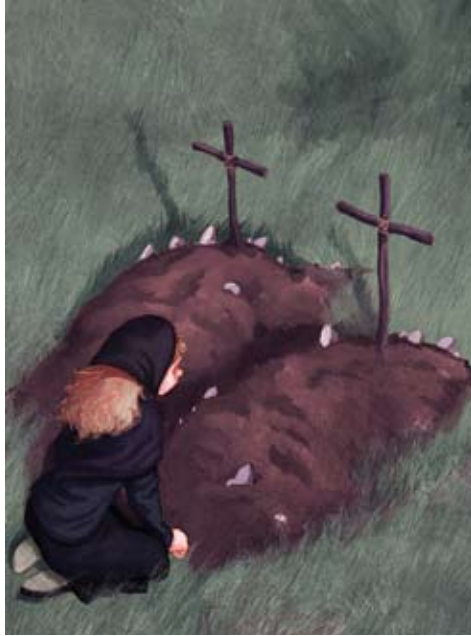
Figura 18. Més de la meitat de la població molletana va morir de pesta