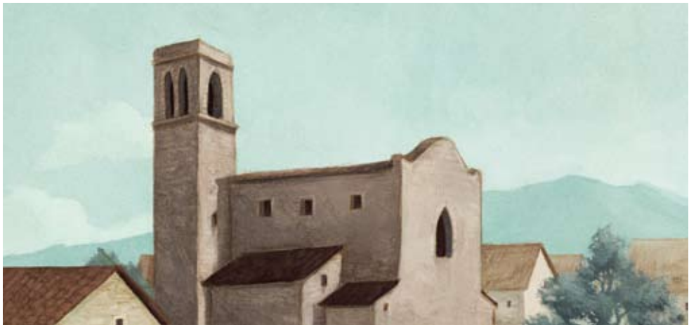
Figura 1. Antiga església de Mollet