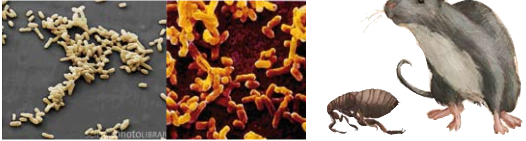
Figures 14 i 15. Yersinia Pestis . Rates i puces són el reservori de la pesta

(1650) i posteriorment amb la progressió de l'epidèmia des dels nuclis meridionals que anaren avançant cap al nord travessant la Conca de Barberà, l'Urgell, la Segarra, l'Alt Penedès, el Garraf, el Baix Llobregat, el Vallès Occidental, el Barcelonès amb la gran epidèmia a Barcelona 19 , i novament Vallès Oriental i Maresme, la Selva i el Gironès (finals de 1651).