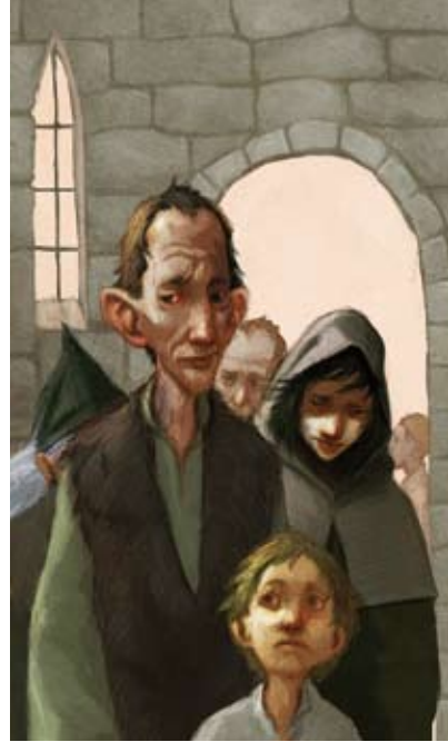
Figura 20. Els síndics locals obligaven els malalts a anar als centres on determinaven

gran devoció popular per la figura de la Mare de Déu. Tot i que no correspon a la Mare de Déu de la Pietat, una part important de la població la venera com a tal, i segueix demanant-li ajuda per sortir de situacions difícils o li dona les gràcies per les coses bones que la vida els ha donat.