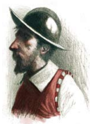
Figura 7. Soldat