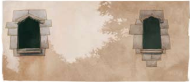
Figura 17. Finestres de l'antic hospital de Mollet

Fou arran d'un altre brot de pesta que l'any 1403, el rei Martí l'Humà fundà l'Hospital de la Santa Creu i és molt possible que un brot infecció d'una malal-