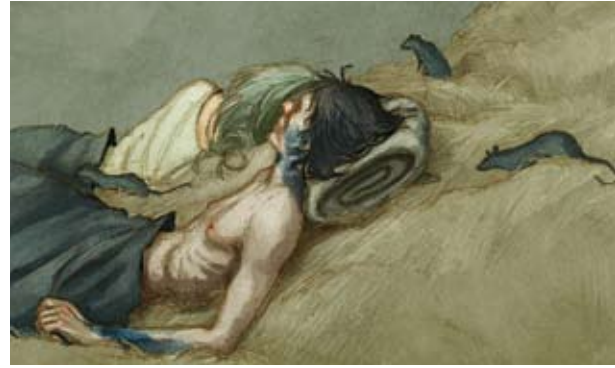
Figura 12. Les rates i les malalties formaven part de la vida quotidiana

La capitulació de Barcelona l'11 d'octubre de 1652 12 va ser el pas quasi definitiu de la derrota catalana, molt especialment dels pagesos que eren la immensa majoria dels habitants de pobla-