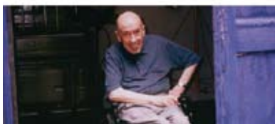
Figura 1. Imatge de la capçalera del web creat per l'Ajuntament de Roda de Ter amb motiu del 10è aniversari de la mort de Miquel Martí i Pol

els mots adequats per definir el seu sentir, de manera que, per molt que busquessin, els costaria identificar-se tant amb d'altres maneres igualment interessants d'encadenar artesanalment els mots que configuren la nostra llengua, aquest idioma que Miquel no va deixar de treballar,